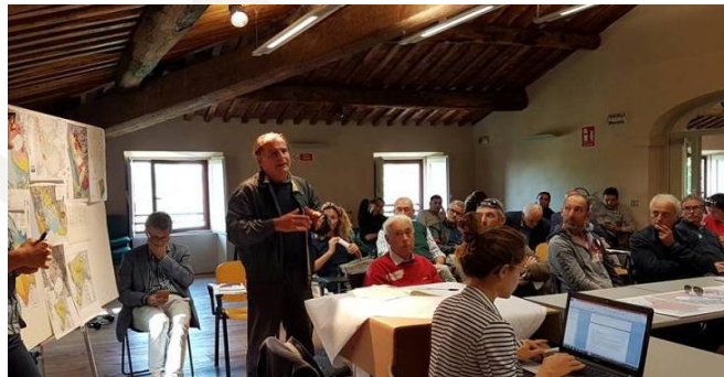
Tavolo del Contratto di Lago “Tutela”