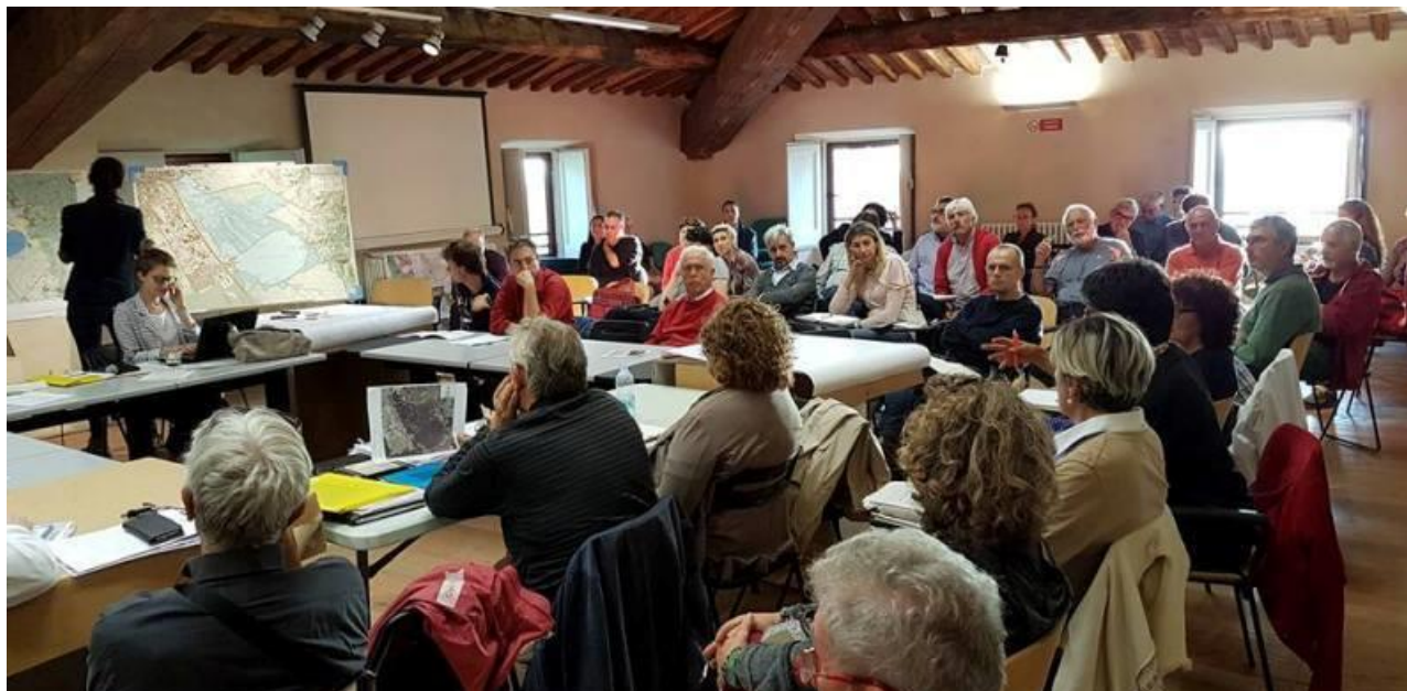
Tavolo del Contratto di Lago “Promozione”